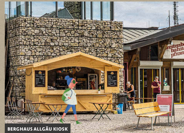
BERGHAUS ALLGÄU KIOSK