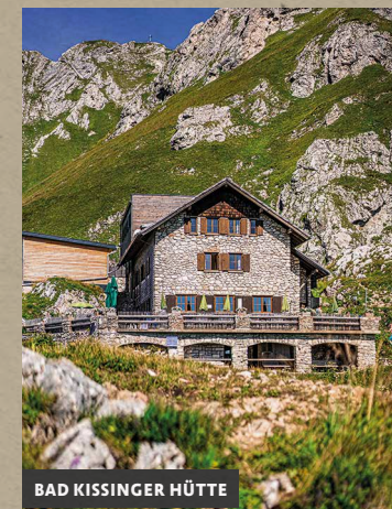
BAD KISSINGER HÜTTE

5 BREITENBERGBAHN BISTRO www.breitenberg-bistro.de Wir verwöhnen euch auf einer herrlichen Sonnenterrasse direkt am Spielplatz mit hausgemachten Kuchen und leckeren Schmankerln. Direkt an der Talstation der Breitenbergbahn.